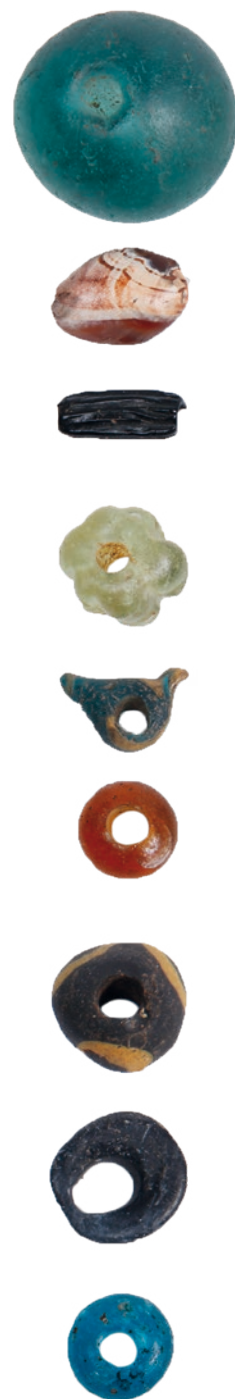
18 Διάφοροι τύποι γυάλινων χανδρών.

Μιχάλης Πετρόπουλος: Μια οκτώσχημη πόρπη μαζί με άλλα χάλκινα αντικείμενα, δίδυμη περόνη, δίσκο, δύο περόνες, κρίκο και πολυμερές αδιάγνωστο αντικείμενο, που προέρχονται από το ιερό της Αοντίας Αρτέμιδος, εντοπίστηκαν πριν από λίγα χρόνια στο Ashmolean Museum στην Οξφόρδη από τη συνάδελφο Αναστασία Γκαδόλου. Μία άλλη πόρπη, ακέραια, με τόξο και πλακίδιο, βρίσκεται στο Μουσείο Καλών Τεχνών της Βοστώνης από το 1898 και έχει ένδειξη προέλευσης την Αχαΐα. Πρόκειται για πόρπη μεγάλων διαστάσεων, μήκους 14 εκ. και πλάτους 12,4 εκ. Φέρει στη μία πλευρά του πλακιδίου εγχάρακτη παράσταση με τον Ηρακλή, τον Ιόλαο και τη Λερναία Ύδρα και στην πίσω πλευρά τον Ηρακλή με την Κερυνίτι έλαφο. Η πόρπη αυτή αποδίδεται στον χαράκτη, που είναι γνωστός συμβατικά με το όνομα «Lion Engraver». Σύμφωνα με την επιστημονική της δημοσίευση του 1911 βρέθηκε σε περιοχή κοντά στην Πάτρα. Δεδομένου δε ότι τα εισαχθέντα το 1908 στο Ashmolean Museum γεωμετρικά αντικείμενα από τη Ρακίτα, κατά το ευρετήριο του Μουσείου, είχαν βρεθεί το 1896, δηλαδή την ίδια περίπου περίοδο με την εισαγωγή της πόρπης στο Μουσείο Καλών Τεχνών της Βοστώνης, πιστεύω ότι και η πόρπη αυτή προέρχεται από τη Ρακίτα. Η λαθρανασκαφή του τέλους του 19ου αιώνα στο ιερό της Αρτέμιδος φαίνεται να επιβεβαιώνεται και από την ανεύρεση στον αποθέτη κάλυκα σφαίρας ΚΥΝΟΧΗ από περίστροφο του τέλους του 19ου αιώνα, πράγμα που δείχνει έκνομη δραστηριότητα στην περιοχή του ιερού την ίδια περίοδο.