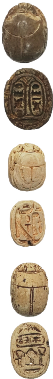
17 Αιγυπτιακοί σκαραβαίοι.

θραυσμένα οστά ζώων και κέρατα ελαφιού, 11) πήλινα αγγεία, 12) ομοιώματα κτηρίων, 13) πλακίδια με ζωγραφικές παραστάσεις, 14) μικρά πνία, και 15) μολύβδινα ελάσματα. Τεράστιος ήταν και ο αριθμός των οστράκων, δηλαδή των θραυσμάτων πήλινων αγγείων.