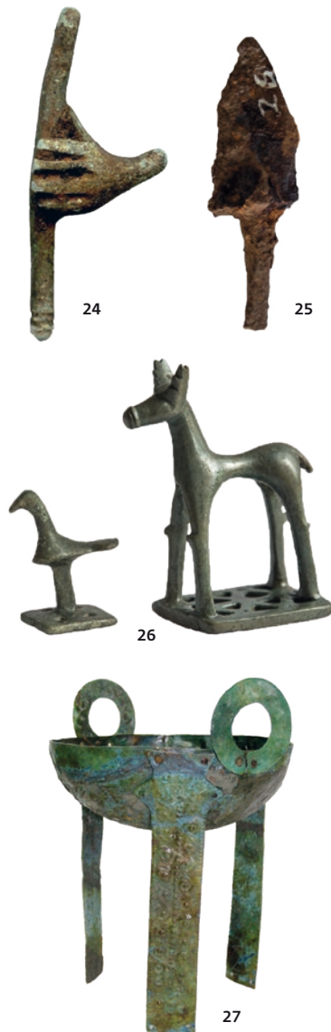
24 Χέρι που κρατά τόξο, τμήμα χάλκινου ειδώλιου, ασυντήρητο.