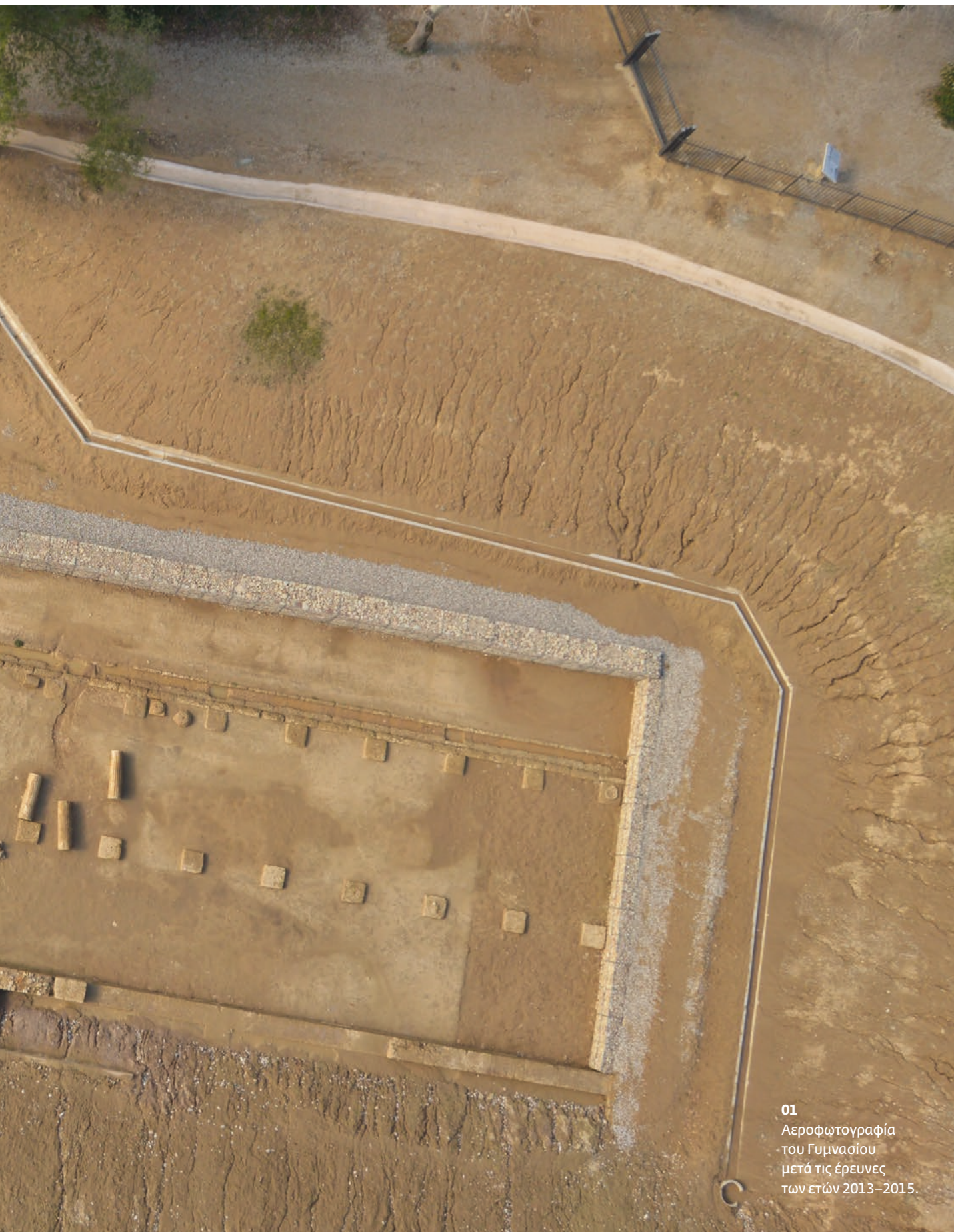
01 Αεροφωτογραφία του Γυμνασίου μετά τις έρευνες των ετών 2013–2015.