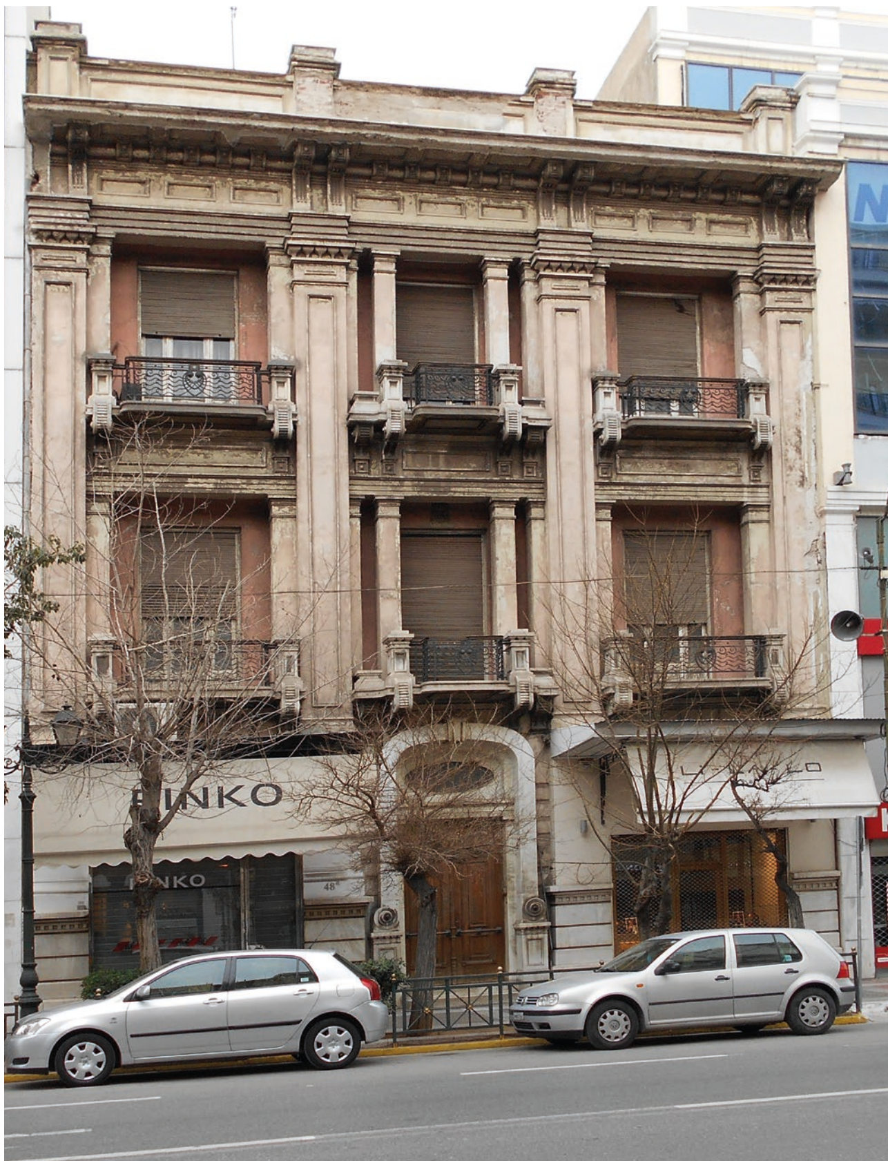
05 Οικία Καζανόβα στη λεωφόρο Ηρώων Πολυτεχνείου 50.