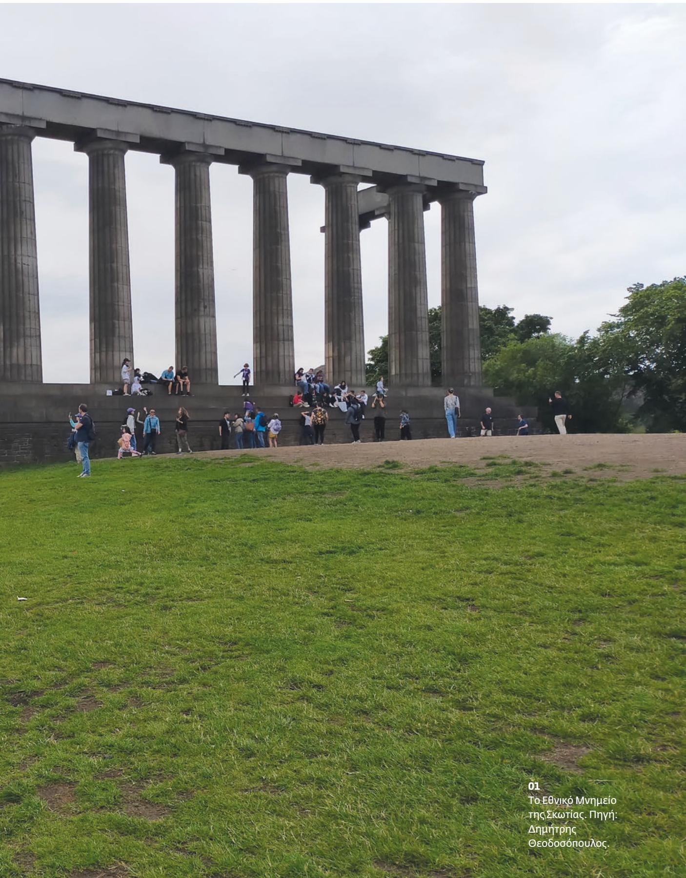
01 Το Εθνικό Μνημείο της Σκωτίας.