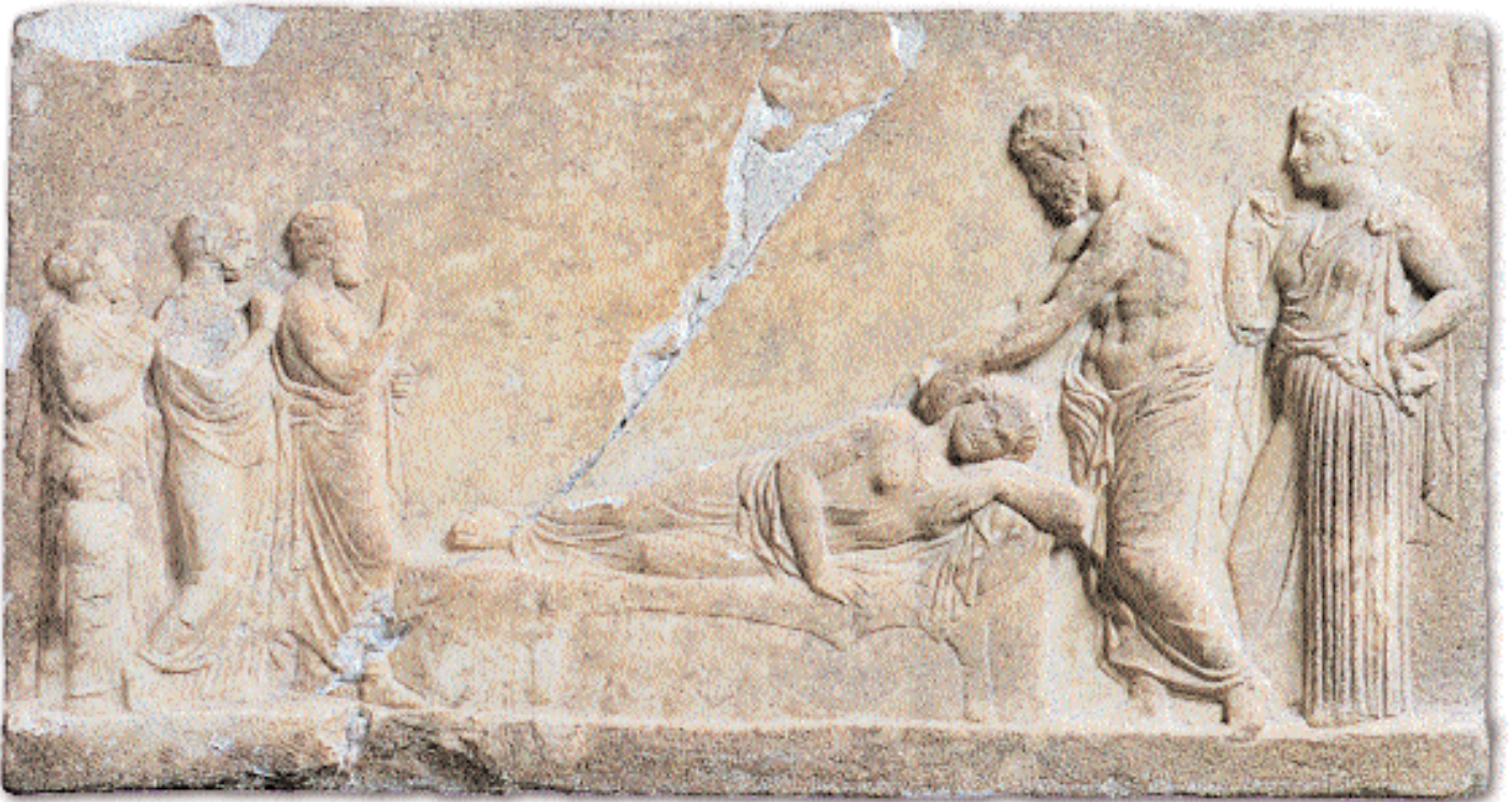
3. Ανάγλυφο αφιερωμένο στον Ασκληπιό και την Υγίεια. Ο θεός εικονίζεται να γιατρεύει μια γυναίκα, που είναι ξαπλωμένη στο άβατο και τον βλέπει στον ύπνο της. Ασκληπιείο Πειραιά, περ. 400 π.Χ. Πειραιάς, Αρχαιολογικό Μουσείο.

(Αρχαία Ελλάδα, Βυζάντιο, Νεότερα Χρόνια, Σύγχρονη Ελλάδα) – και οι οποίες έχουν ως στόχο να προκαλέσουν την επικρατούσα γνώμη, δημιουργώντας νέες προοπτικές όσον αφορά το τι σημαίνει «ιατρική». Ενδεικτικά, μπορούν να αναφερθούν οι θεραπευτικές ουσίες στην αρχαία Ελλάδα, τα φαρμάκια στα παραμύθια και τα σύγχρονα θεραπευτικά σκευάσματα, η αρχαία μαιευτική, οι παραδοσιακές πρακτικές γέννας και η υποβοηθούμενη αναπαραγωγή στη σύγχρονη χιλιετία, καθώς και οι αναπαραστάσεις της ασθένειας και οι ιατροί στο αρχαίο θέατρο, στο θέατρο του 20ού αιώνα και στα έργα του Καζαντζάκη.