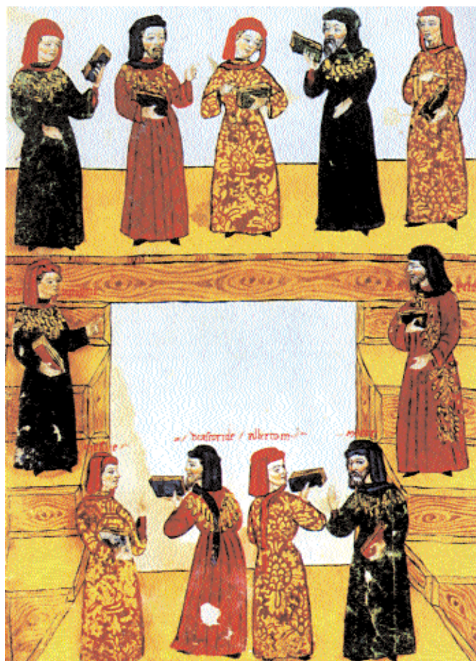
1. Οι γεννήτορες της ιατρικής και της φαρμακολογίας (ξεκινώντας από επάνω, από αριστερά προς τα δεξιά): Ασκληπιός, Ιπποκράτης, Αβικέννας, Ραζής, Αριστοτέλης, Γαληνός, Μάσερ, Αλβέρτος ο Μέγας, Διοσκουρίδης, Μεσουέ, Σεραπίων. Χειρόγραφο του Γιοχάνε Καντεμόστο, 15ος αι.

Η ιστορία της ιατρικής ως «μεγάλη παράδοση» –ως χρονικά της επίσημης, κυρίαρχης γνώσης– έχει την τάση να αποσιωπά τη φωνή των «μικρών παραδόσεων», 1 μιας και η ιατρική του απλού κόσμου, παρότι αντιμετωπίζει τα φαινόμενα δυστυχίας στην καθημερινή ζωή, υποβαθμίζεται στον επιστημονικό λόγο, θεωρούμενη ως πρωτόγονη, λαϊκή, μη-εμπειρική. (Αξίζει να σημειωθεί εδώ ότι, σύμφωνα με τον Κλάινμαν (Kleinman 1980), τα περισσότερα προβλήματα υγείας λύνονται έξω από το χώρο της επίσημης ιατρικής.) Η μελέτη αυτών των θεραπευτικών παραδόσεων «των ανθρώπων χωρίς ιστορία» (Wolf 1982) σχημάτισε τη βάση του αναδυόμενου κλάδου της ιατρικής ανθρωπολογίας κατά τη δεκαετία του 1970 (Fabrega 1970· Foster 1987· Logan / Hunt 1978· Rubel 1977). 2 Ο Α. Κλάινμαν (Kleinman 1980), ψυχίατρος και ανθρωπολόγος, ορίζει τρεις σφαίρες ιατρικών συστημάτων, οι οποίες εμπλέκονται και αλληλεπιδρούν: 1) τη λαϊκή ιατρική, όπως τα γιατροσόφια και τις γνώσεις και πρακτικές του ευρύτερου μη-εξειδικευμένου πληθυσμού, 2) την παραδοσιακή ιατρική των ιθαγενών (την οποία ασκούν οι σαμάνοι, οι curanderos , οι «μάγοι-θεραπευτές», οι χαρισματικοί θεραπευτές) και 3) τη βιο-ιατρική, την ιατρική που παράγεται στον δυτικό κόσμο. Αυτή η τυπολογία, με μερικές τροποποιήσεις, επιτρέπει την ενσωμάτωση των νέων θεραπευτικών συστημάτων που